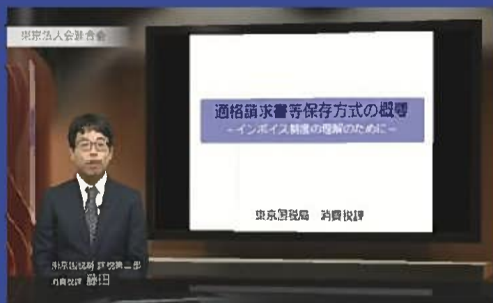
適格請求書等保存方式の概要 —インボイス制度の理解のために— (約 33 分)