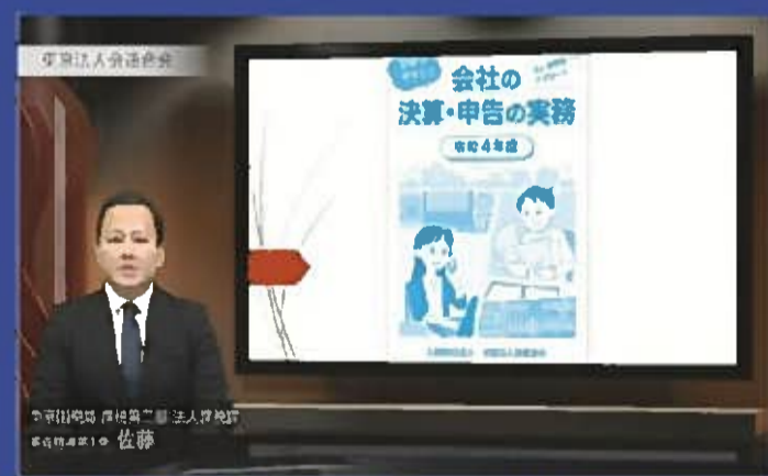
会社の実務・申告の実務について (法人税編) (約 34 分)