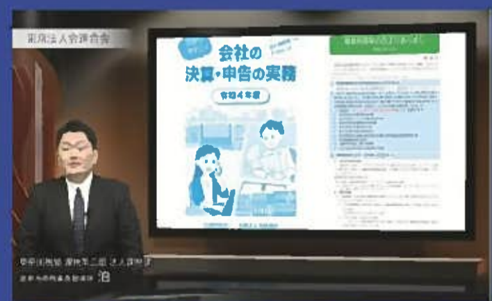
会社の実務・申告の実務について (源泉所得税編) (約 22 分)